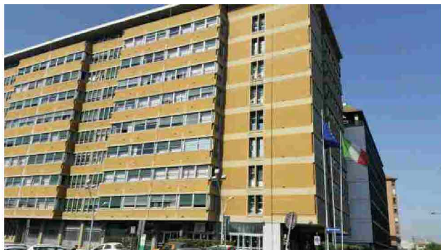
La sede del Ministero dell'Ambiente e Sicurezza Energetica (ex Ministero della Transizione Ecologica ed ex Ministero dell'Ambiente), in via Colomdo a Roma

Il decreto-legge Ambiente n°153 è legge . È stato pubblicato in Gazzetta Ufficiale, nella Serie Generale del 17 ottobre. Entra dunque in vigore il provvedimento approvato nel Consiglio dei Ministri del 10 ottobre scorso, su proposta del Presidente Giorgia Meloni e del Ministro dell'Ambiente e della sicurezza energetica Gilberto Pichetto Fratin . Il decreto, ora atteso all'esame