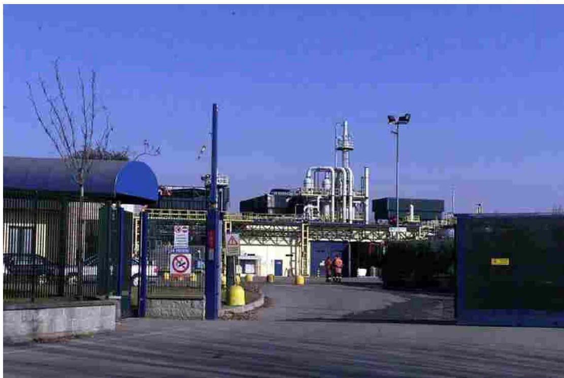
Finchimica a Manerbio - © www.giornaledibrescia.it

Quello appena iniziato si preannuncia come il mese della verità per il caso Finchimica . Entro fine gennaio le analisi in corso da parte di Arpa stabiliranno se l'inquinamento diffuso riscontrato all'interno del perimetro aziendale dello stabilimento di fitofarmaci stia mettendo a rischio le falde all'esterno dell'impianto produttivo, oppure se esso è confinato al solo interno.