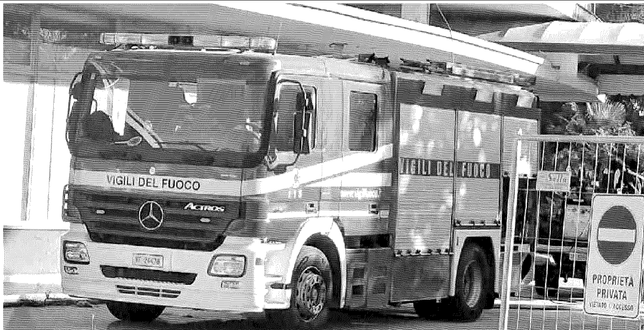
PRINCIPIO DI INCENDIO Ennesima intrusione nell'ex hotel Bertha: qualche giorno fa in un vicino negozio di anquariato c'era stato un furto