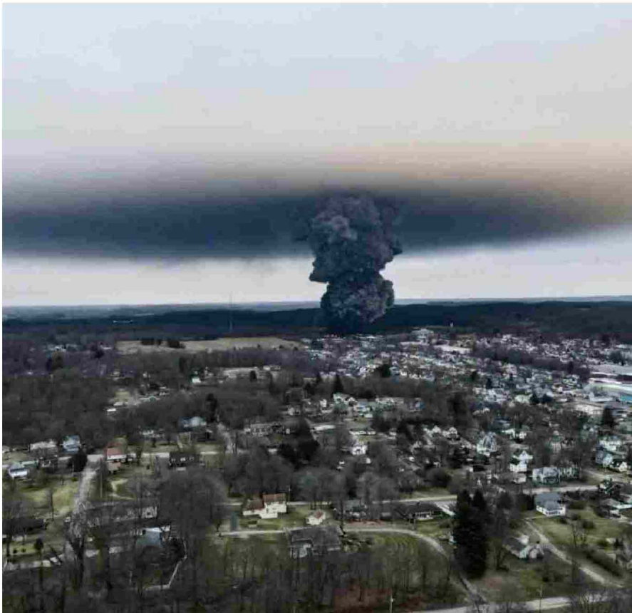
Incidente ferroviario in Ohio