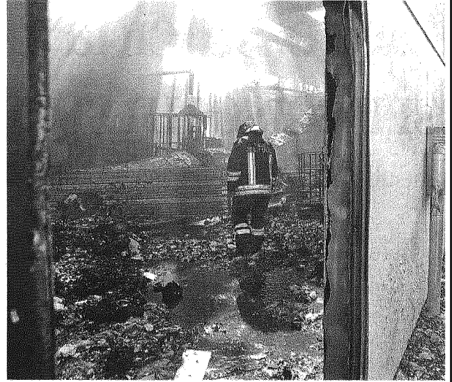
Paura e devastazione I pompieri al lavoro alla Bergen di Castel D'Azzano, dove ieri un incendio ha devastato un magazzino