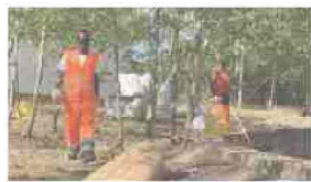
"SERRA RIFUSA", AL VIA LA PREVENZIONE INCENDI