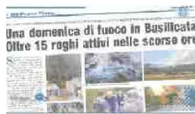
UNA DOMENICA DI FUOCO IN BASILICATA OLTRE 15 ROGHI ATTIVI NELLE SCORSE ORE