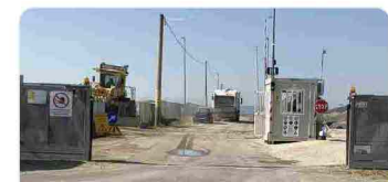
DISCARICA "LA MARTELLA", UN ANNO FA IL ROGO - Matera, prosegue la bonifica della di... lecronachelucane.it