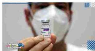
COVID, NESSUN DECESSO NELLE SCORSE 24 ORE