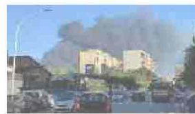
SINDACO DI ROMA ROBERTO GUALTIERI: NON È IL MOMENTO DI SPECULAZIONI POLITICHE E DI DIVISIONI