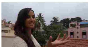
CINEMA: POTENZA, UN CORTO CON MISS INDIA