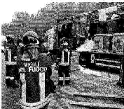
I pompieri hanno lavorato per ore per domare le fiamme del camion