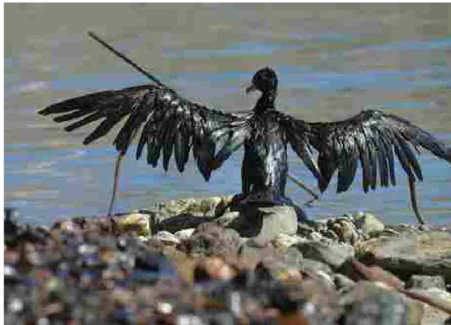
I danni causati da uno sversamento di petrolio