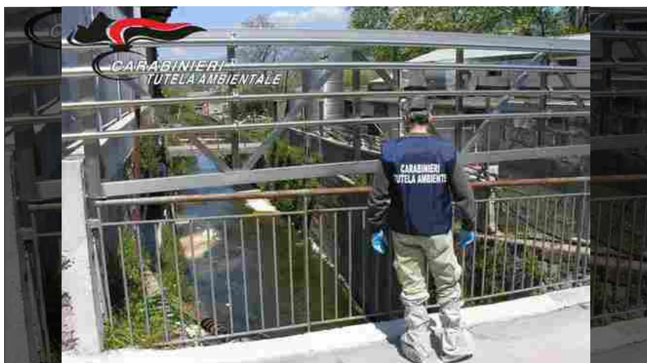
Tanti anche nel territorio bresciano gli episodi di allarme per l'inquinamento: controlli dei carabinieri del nucleo deputato alla tutela ambientale

Dopo l'indagine dei Carabinieri Forestali, arrivano le diffide della Provincia di Brescia affinché i responsabili dell'inquinamento del torrente Carfio provvedano a presentare un piano di caratterizzazione. A maggio scorsi, i Carabinieri Forestali della stazione di Vobarno avevano scoperto un vero e proprio disastro ambientale all'interno del torrente Carfio, in Val Sabbia, frutto di anni di immissione continua di percolato da tre discariche (su 5 ettari) legate ad acciaierie. Nei sedimenti del torrente, l'Arpa ha individuato superi delle concentrazioni soglia di contaminazione per piombo, cadmio, zinco e Pcb. Le sorgenti di contaminazione primarie sono state individuate nelle