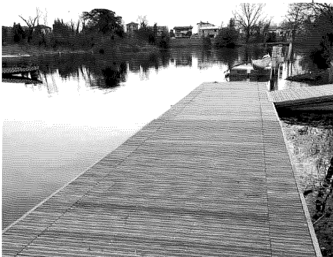
Una veduta del lago della Burida. Da un guasto all'impianto di depurazione è derivato un inquinamento

Guasto al depuratore: liquami nel fiume Per chi è intervenuto una giornata difficile da digerire