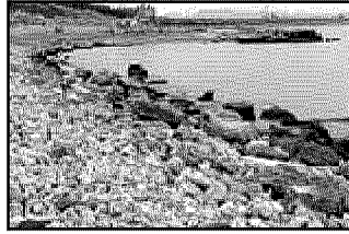
Servizio a pagina 7