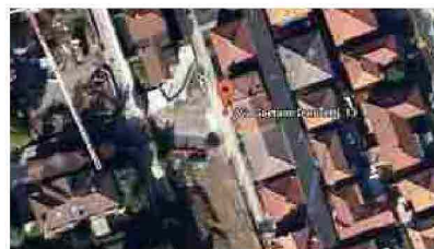
Appartamenti Paderno Dugnano Calderara, Via Gaetano Donizetti