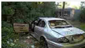
P.S.Elpidio, vandali scatenati, ballano sul tetto di una Jaguar e la distruggono