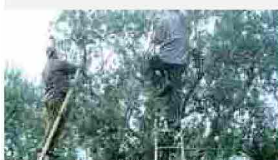
P..Elpidio: spariti tremila chili di olive Erano raccolte e pronte per la macina