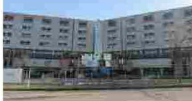
Morto il bimbo caduto in piscina Nonna denunciata dai carabinieri Donati gli organi: salve 4 vite