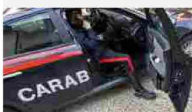
Porto S.Elpidio, coppia inizia a litigare a calci e pugni: arrivano i carabinieri