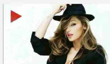
Anna Tatangelo al centro del gossip, la cantante è furiosa: «Uno schifo»