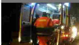
P.S.Elpidio, giovane ciclista di colore investito da un'auto sulla statale