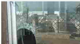
P.S.Elpidio, ladri in azione allo chalet rubati tv e palmare, caccia alla banda

Auto si ribalta dopo lo scontro, paura a Torrette