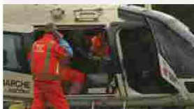
Montegranaro, cade da una pianta di ulivo, paura per un agricoltore