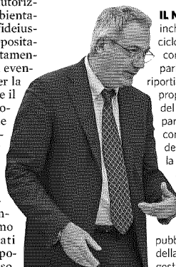
Il presidente Alessandro Bratti è deputato del Pd Anso

IL NOME COMPLETO è "Commissione di inchiesta sulle attività illecite connesse al ciclo dei rifiuti e su illeciti ambientali ad esse correlati": si tratta di una commissione parlamentare d'inchiesta e la notizia che riportiamo in questa pagina è stata raccontata proprio durante l'audizione di un assessore del Comune di Adria, di fronte ai parlamentari che la compongono. La commissione indaga sugli illeciti ambientali del ciclo dei rifiuti, ma anche sui reati contro la pubblica amministrazione e dei reati associativi connessi al ciclo dei rifiuti, alle bonifiche e al ciclo della depurazione delle acque. Tra i suoi compiti: verificare l'attuazione delle normative e le inadempienze da parte dei soggetti pubblici e privati, verificare i comportamenti della pubblica amministrazione, le modalità di gestione dei servizi di smaltimento dei rifiuti, svolgere indagini per far luce sul ciclo dei rifiuti, sulle organizzazioni che lo gestiscono, sui loro assetti societari e sul ruolo svolto dalla criminalità organizzata, nonché individuare le connessioni tra le attività illecite nel settore dei rifiuti e altre attività economiche