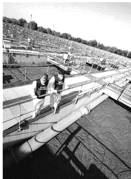
Rifiuti tossici La "Coimpo" di Adria è una ditta che si occupa del trattamento dei fanghi industriali e rifiuti liquidi Anso

L'autorizzazione senza garanzie non può rimanere valida, e la provincia avvia il pro-