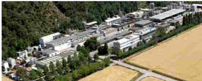
Una vista aerea della Miteni di Trissino

VENEZIA. Accusata da più parti, l'azienda chimica Miteni spa, nell'occhio del ciclone per il disastro ambientale che ha contaminato un ampio territorio dell'ovest vicentino, nega ogni responsabilità nell'inquinamento di falde e acque superficiali. Ma uno studio epidemiologico condotto sui lavoratori che hanno operato nello stabilimento di Trissino perviene a conclusioni sconcertanti: a fronte di una concentrazione fisiologica di 4-5 nanogrammi di sostanze perfluoroalchilici per grammo di sangue, i valori riscontrati nel siero delle maestranze più esposte al trattamento dei Pfas raggiungono picchi di 47 mila (sic) nanogrammi. A documentarlo, non è un comitato di ambientalisti arrabbiati ma il direttore della Scuola di specializzazione in medicina del lavoro dell'Università Statale di Milano, Giovanni Costa, responsabile della sorveglianza sanitaria dei lavoratori Miteni (e prima ancora della Rimar, Ricerche Marzotto, che operava nel medesimo insediamento industriale), autore di una pubblicazione scientifica che riassume l'andamento dei test condotti tra 1978 e 2007, un arco di tempo cruciale, corrispondente - secondo l'Arpav che ha condotto i sopralluoghi e segnalato alla magistratura l'azienda vicentina - al processo di inquinamento delle falde nella valle del Chiampo e dell'Agno.