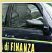
Brescia, sequestrata la villa di un notaio