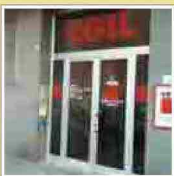
Cgil Brescia primo sindacato alla Poliambulanza