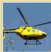
Gardone Vt, muore potando una pianta