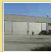
Zanzanù ritorna, nuova occupazione