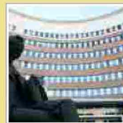
Brescia, libero "piromane" via Tosoni