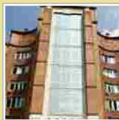
Rezzato, deceduto ciclista investito