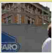
Caffaro, Tar esclude Sorin dalla bonifica