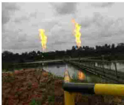
Gas flares nel delta del fiume Niger, ovvero quando i gas prodotti in eccesso vengono bruciati in atmosfera.

Un problema complesso che riguarda una bonifica definitiva dell'area che potrebbe richiedere fino a 30 anni di tempo , e per la quale le comunità locali non hanno più intenzione di attendere.