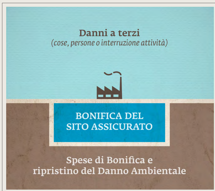
Fig. 2 — Schema della Garanzia Base (Polizza RA Insedimenti 2011)

— Danno Ambientale : Tutte le spese per il ripristino del Danno Ambientale (primario, complementare e compensativo) per riportare il sito alle condizioni originarie.